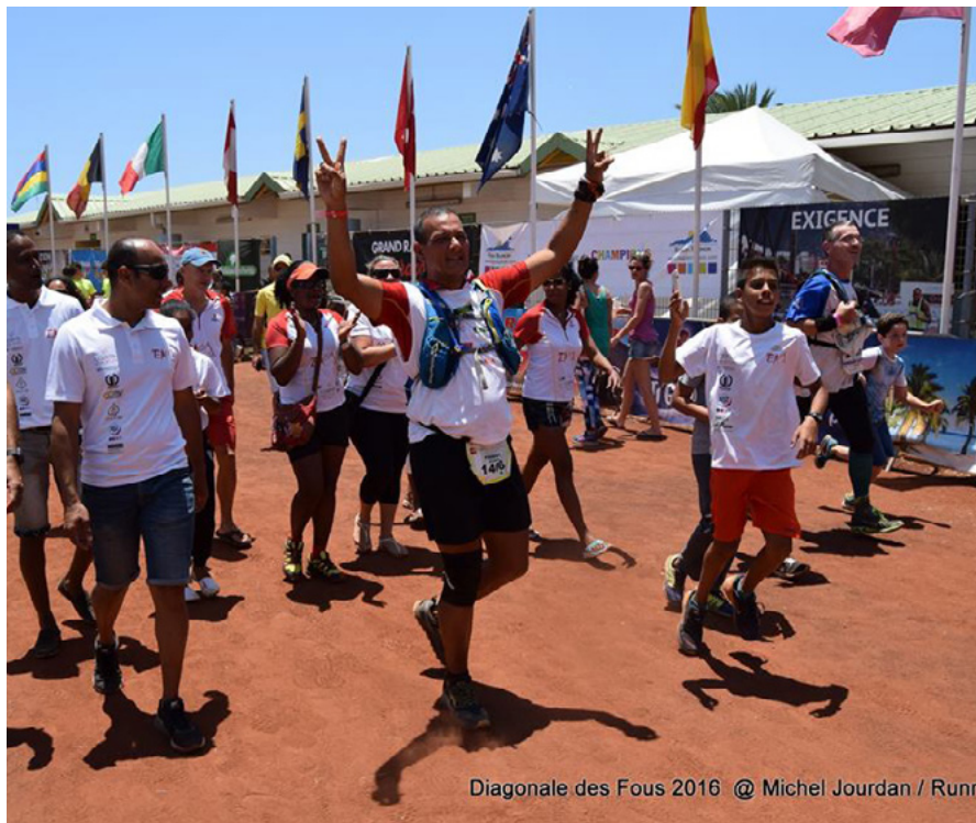
Diagonale des Fous 2016 @ Michel Jourdan / Run